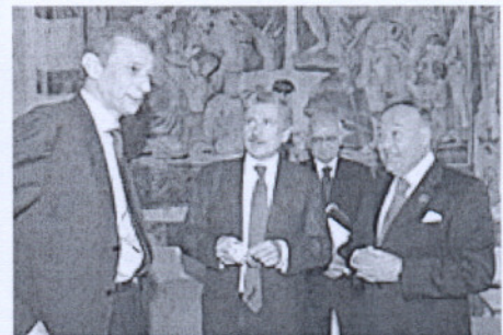
Reunión de ministros de Exterior en el palacio Farnesina de Roma

Para los ministros la integración de los pueblos es necesaria para su crecimiento